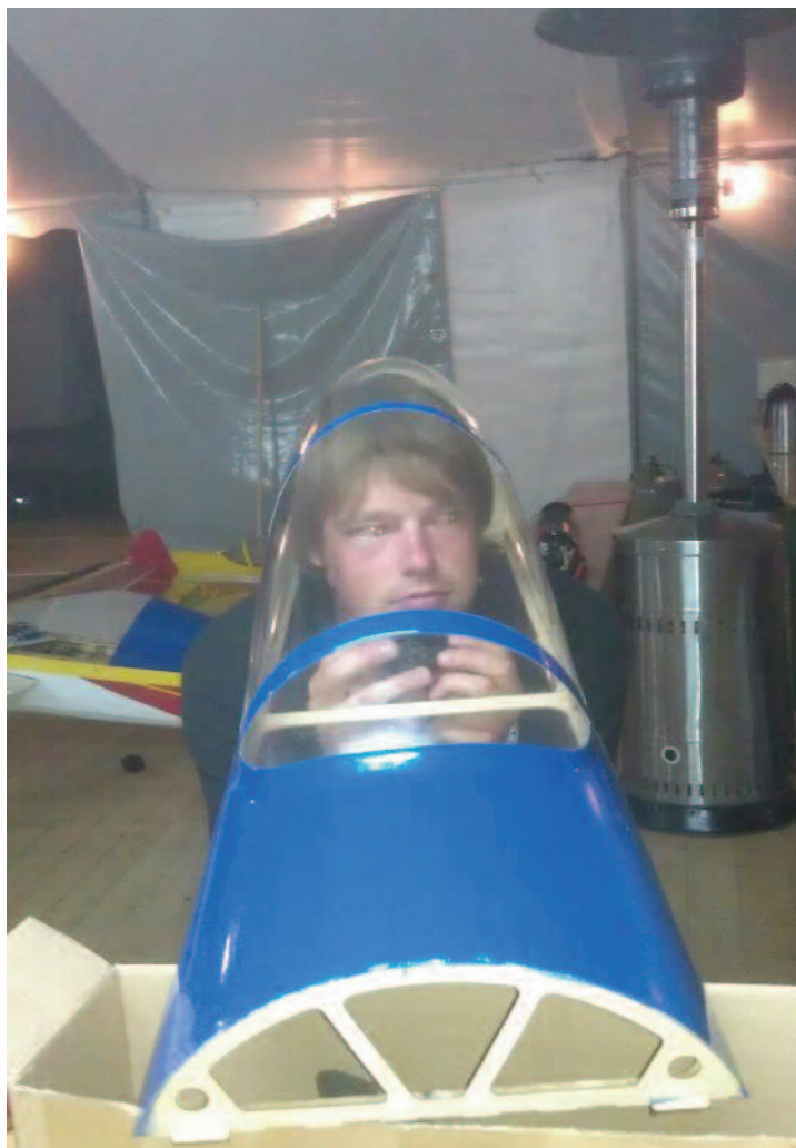
Yannics eerste solovlucht